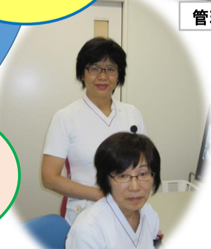
糖尿病看護認定看護師 日本糖尿病療養指導士