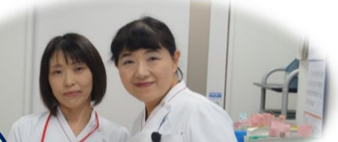
皮膚・排泄ケア認定看護師(左) 皮膚科外来看護師(右)